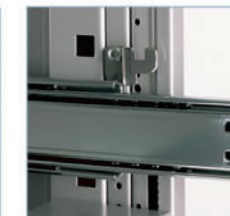
Suspension sur roulements à billes