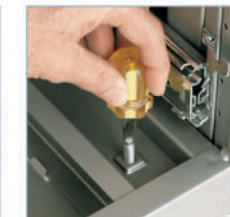
Accès aux niveleurs par l'intérieur