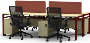
Produit de référence