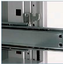
Suspension sur roulements à billes