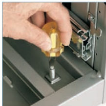
Accès aux niveleurs par l'intérieur